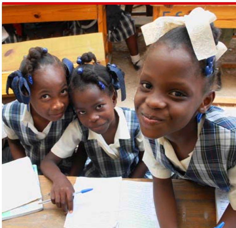
Die Kinder der Schule von Trou Sable in Gonaïves hoffen auf eine bessere Zukunft.

* Einschulung von 450 Kindern in der Schule von Trou Sable und Planung einer Berufsschule in Gonaïves