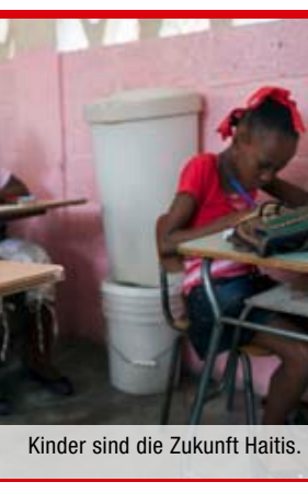
Kinder sind die Zukunft Haitis.

Caritas Schweiz setzt 800 000 Franken gegen Cholera in Artibonite und Gressier ein. Caritas verteilte 7000 Hygienesets und sichert den Zugang zu Trinkwasser für 15 000 Familien und 65 Schulen in Gressier sowie 15 Schulen in Gonaïves. Eine Radiokampagne wird ausgestrahlt und Bildungsmaßnahmen klären die Bevölkerung in den Regionen Gonaïves und Gressier über Präventionsmassnahmen auf. In Port-au-Prince wird die Organisation RHASADE unterstützt. 420 000 Personen profitieren von der Caritas-Hilfe gegen Cholera.