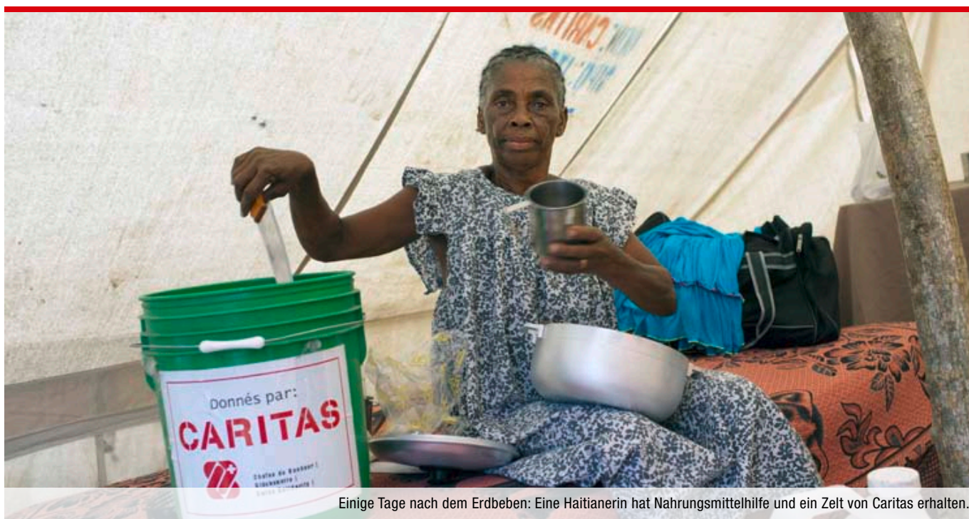
Einige Tage nach dem Erdbeben: Eine Haitianerin hat Nahrungsmittelhilfe und ein Zelt von Caritas erhalten.