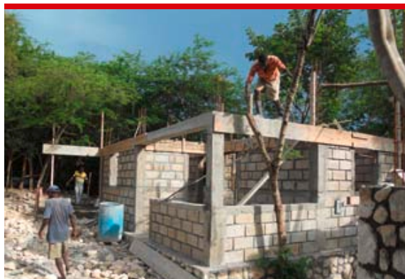
1700 Häuser sollen unter Mitarbeit der begünstigten Familien errichtet werden.

Die beiden Wiederaufbauprojekte erstrecken sich über vier Jahre; das Budget beträgt 40 Millionen Franken und wird von der Glückskette mitfinanziert. Caritas Schweiz und ITECA haben im Dezember mit dem Bau der ersten 100 Häuser begonnen, die im April 2011 fertig sein sollten.